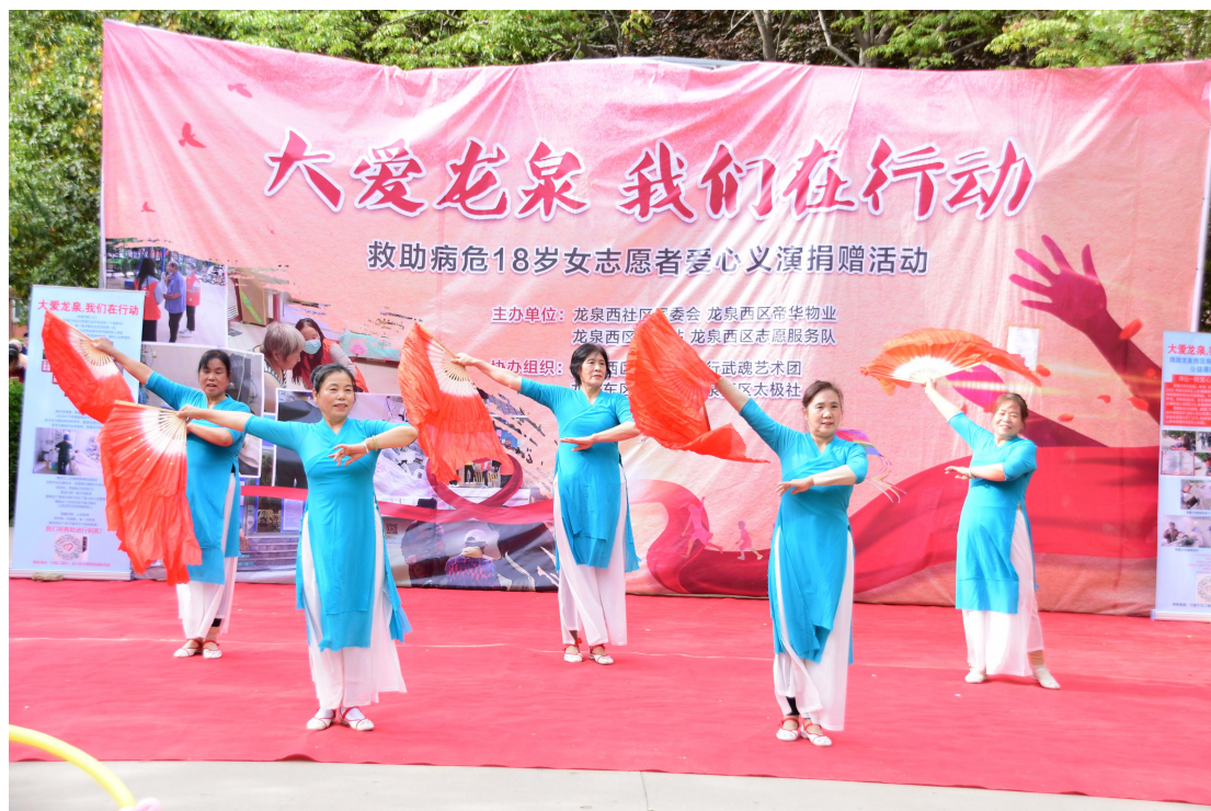
（鹿泉上庄镇龙泉西区社区广场“大爱龙泉 我们在行动”义演活动现场）