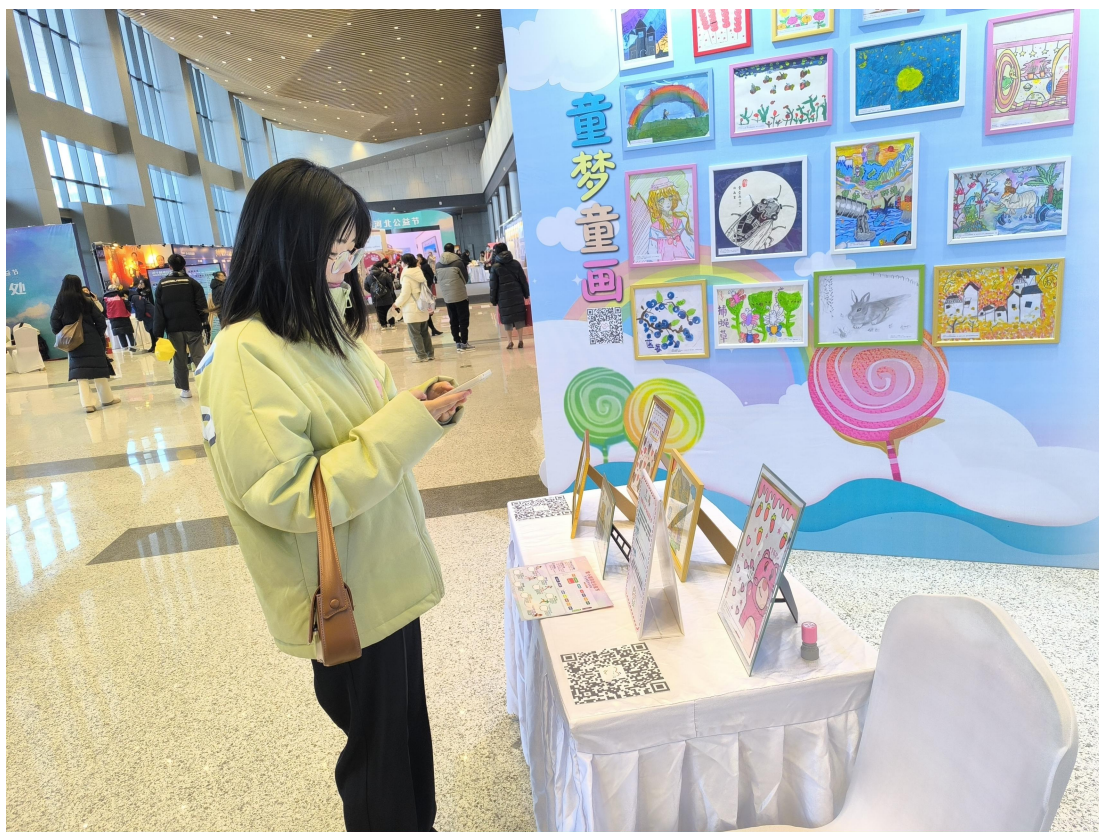
（河北慈善联合基金会-第十届河北公益节《童梦童画》义卖现场）

截至 2023 年 12 月，“童梦童画·手绘作品爱心义卖活动”收集到 9 名患儿共计 40 幅绘画作品，并挑选出 30 幅优质作品进行包装义卖，目前部分作品已通过时光公益平台“益起买”版块义卖寄出。