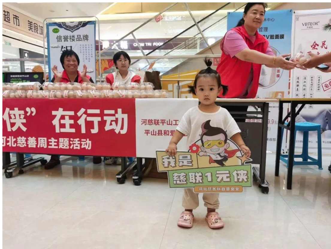
（河北慈善联合基金会-平山工作站开展“慈联 1 元侠”劝募活动）

截至 2023 年 12 月，“慈联 1 元侠”全省联动活动汇聚了省内 14 地市（含定州市、辛集市及雄安新区）的 996 个爱心社区、180 家爱心企业、77 所爱心学校、63 家社会组织参与的 8.8 万余名爱心人士力量，在省内开展了 1228 场活动，为大病患者筹集善款 14.76 万余元。