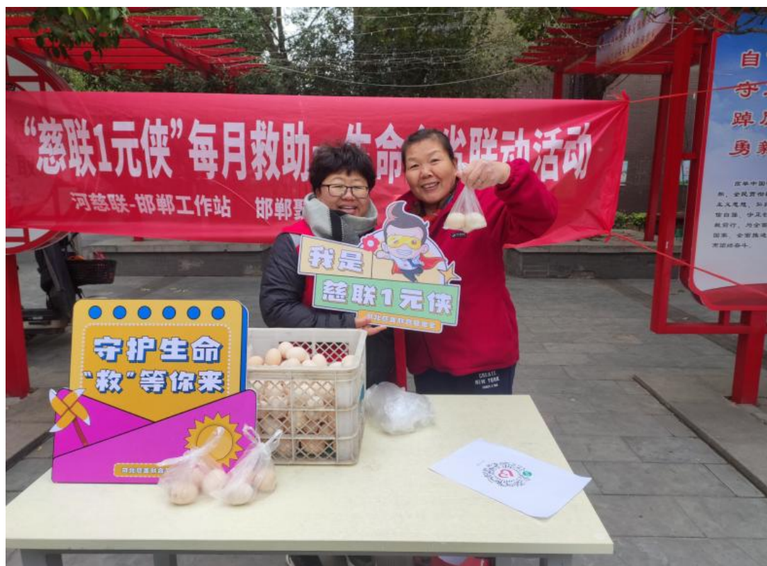
（河北慈善联合基金会-邯郸工作站开展“慈联1元侠”劝募活动）