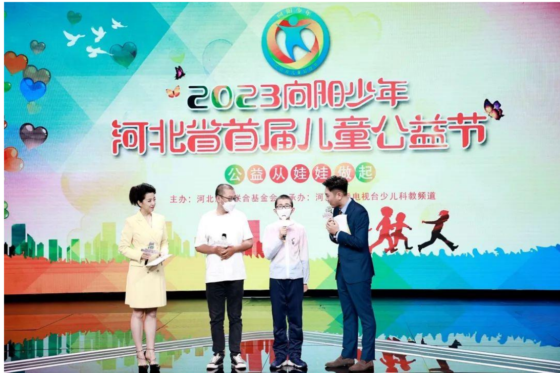
（2023·向阳少年河北首届儿童公益节生命续航受助人上台发表感言）